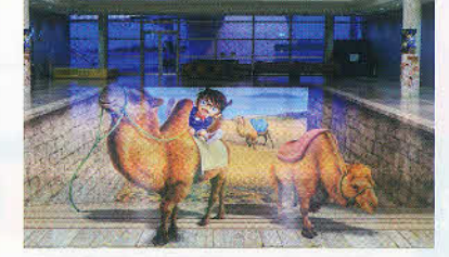
国際会館1F 特大トリックアート