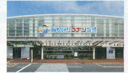
国際会館 特大サイン