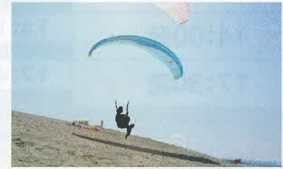
パラグライダー (鳥取砂丘)