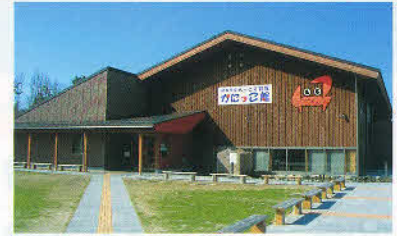
とっとり賀露 かっこ館