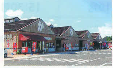
海鮮市場 かるいち