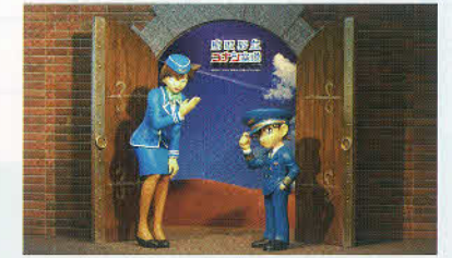
国内線ターミナル到着ロビー ウェルカムスペース

お問い合わせ先 鳥取県交通政策課 TEL0857-26-7099 / FAX0857-26-8107