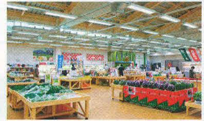
地場産プラザ わったいな