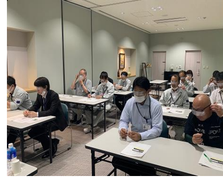
④アイマスク着用でお菓子を開けます