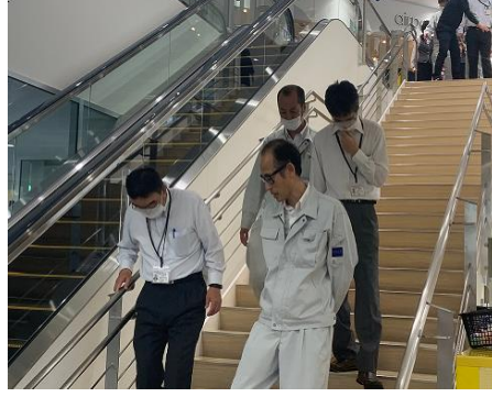
②アイマスクを着用し階段昇降